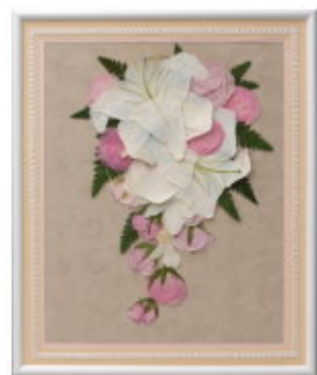
FORM/シェル SIZE/40×50 / 35×42 (cm) 大 ¥44,100- / 小 ¥36,750-