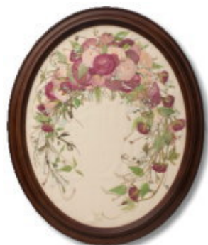
FORM/エリプス SIZE/40×50 (cm) ¥50,400-