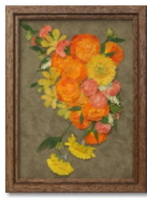
FORM/スクエア FRAME/カンパーニュ SIZE/25×35 (cm) ¥47,250-