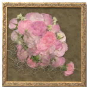
FORM/スクエア FRAME/ロココ SIZE/25×25 (cm) ¥42,000-