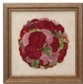
FORM/スクエア FRAME/カンパーニュ SIZE/25×25 (cm) ¥42,000-