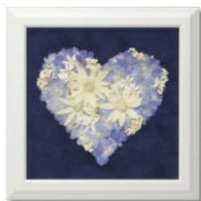
FORM/スクエア FRAME/ブランシュ SIZE/25×25 (cm) ¥42,000-