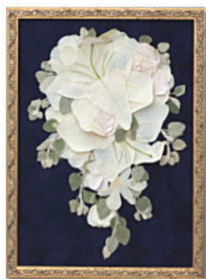
FORM/スクエア FRAME/ロココ SIZE/25×35 (cm) ¥47,250-