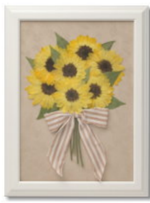
FORM/スクエア FRAME/ブランシュ SIZE/25×35 (cm) ¥47,250-