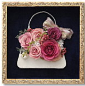
FORM/スクエア FRAME/ロココ SIZE/25×25×10 (cm) ¥52,500-