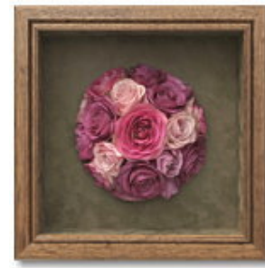
FORM/スクエア FRAME/カンパニー SIZE/25×25×10 (cm) ¥52,500-