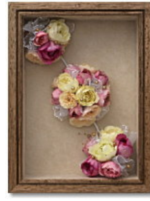
FORM/スクエア FRAME/カンパニー SIZE/25×35×10 (cm) ¥57,750-