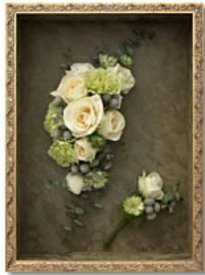
FORM/スクエア FRAME/ロココ SIZE/25×35×10 (cm) ¥57,750-