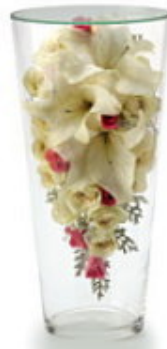
FORM/エリブス SIZE/20×42 (cm) ¥63,000-