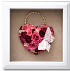
FORM/スクエア FRAME/ブランシュ SIZE/25×25×10 (cm) ¥52,500-