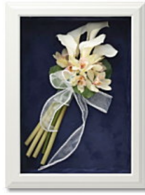
FORM/スクエア FRAME/ブランシュ SIZE/25×35×10 (cm) ¥57,750-